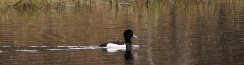
Toppand hann. Forsidefoto: Krikkand hann.

S ørsjøen naturreservat i Tynset kommune ble opprettet 18. desember 1981. Naturreservatet dekker et areal på 3.200 dekar. Formålet med fredningen er å bevare et viktig våtmarksområde i sin naturgitte tilstand og å verne om vegetasjonen, det karakteristiske og interessante fuglelivet og annet dyreliv som naturlig er knyttet til området.